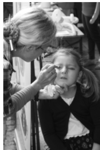
Malowanie twarzy przez nauczycieli MDK

Chociaż jesienna aura nie zachęca do wyjścia z domu, to uczestnicy ostatniego pieszego rajdu MDK mieli szczęście do słonecznej i ciepłej pogody. O dosyć wczesnej porze ponad dwudziestoosobowa grupa ruszyła w kolejny już w tym roku pieszy rajd po okolicach Przemysłu. Zbiórka była jak zwykle przy Młodzieżowym Domu Kultury. Na miejsce rozpoczęcia właściwej trasy w Rokszycach wszyscy dojechaliśmy autobusem. Dopiero kilkanaście kilometrów za miastem rozpoczęliśmy właściwą wędrowkę. Początkowo droga wiodła ciągle pod górę, jednak zmęczenie dało znać dopiero w ostatnim etapie. Na koniec obowiązkowo ognisko z kiełbaskami. W tym roku to już ostatnie wyjście w teren, jednak na wiosnę planujemy kolejne trasy i zapraszamy wszystkich chętnych