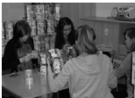
Wolontariusze przy przygotowywaniu puszek

Młodzieżowy Dom Kultury od wielu lat angażuje się w organizację finałów Wielkiej Orkiestry Świątecznej Pomocy. W czasie 24 finału w styczniu 2016 przygotowano wiele atrakcji. Podczas tegorocznej kwesty udało się zebrać 50 072 zł i 67 gr. Od samego rana na ulice miasta ruszyło 89 wolontariuszy z papierowymi puszkami, do których chętni mogli wrzucić datki. Tuż przed rozpoczęciem zbiórki odbyło się spotkanie z funkcjonariuszką policji, która pouczyła młodzież, jak zachować się w niebezpiecznych sytuacjach. Najbardziej wytrwali z wolontariuszy zbierali aż do „światelka do nieba”, które jest kulminacyjnym momentem każdego z finałów WOŚP. Podczas finału, który został zorganizowany w Galerii Sanowej do wyboru było wiele atrakcji przygotowanych