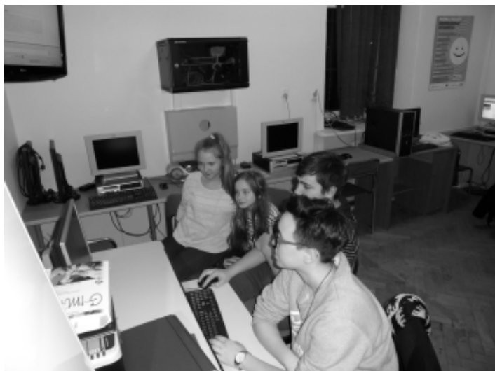
Uczniowie sekcji medialnej przy pracy nad kolejnym artykułem.

W naszym piśmie dowiedziecie się, że młodzież potrafi ciekawie spędzać czas. Zapraszamy do lektury pierwszego wydania pisma pozytywnej młodzieży. Będziecie mogli przeczytać tu m. in. o wydarzeniach organizowanych przez przemyskie szkoły oraz władze miasta. Zobaczycie zdjęcia robione przez naszą sekcję, oraz przeczytać artykuły pisane przez nas. Pokażemy Wam kreatywne i aktywne sposoby spędzania czasu przez młodzież.